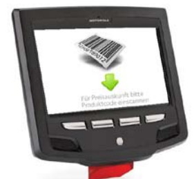
Über einen „Preis-Checker“ können Kunden über das Einscannen von Produktbarcodes den aktuellen Preis der Ware abfragen.

Möchten Sie mehr über dieses Projekt erfahren? Kontaktieren Sie uns - Wir informieren Sie gerne über alle Einzelheiten zu dieser Referenz.