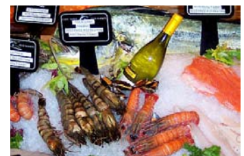
Neben der Belieferung von Hotel- und Gastgewerbe gibt es eine Markthalle für Endkundenverbraucher in in der frische Lebensmittel aus dem reichhaltigen Sortiment angeboten werden.