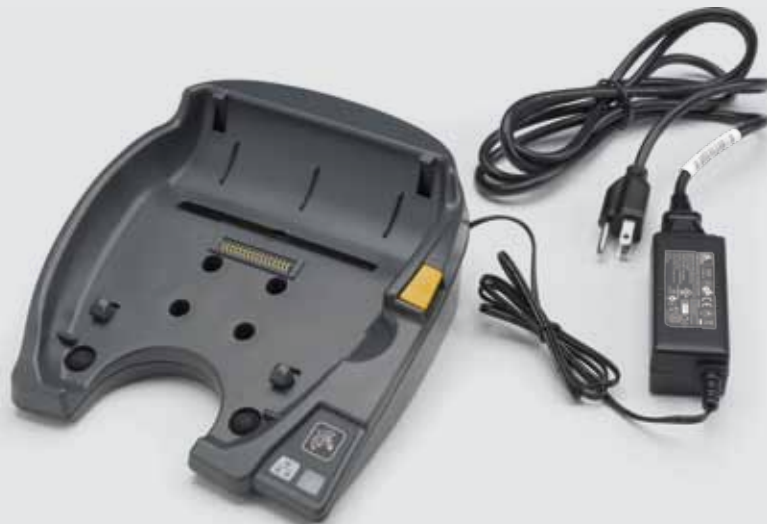
QLn420-Lade- und Ethernet-Docking-Station