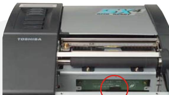
▲ UHF RFID Antenne