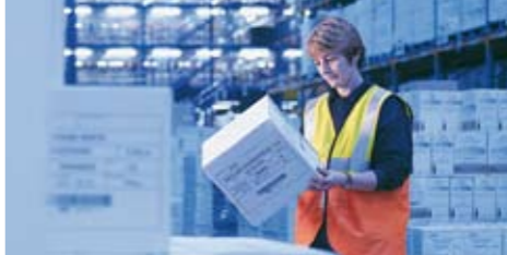
B-SX4 & B-SX5